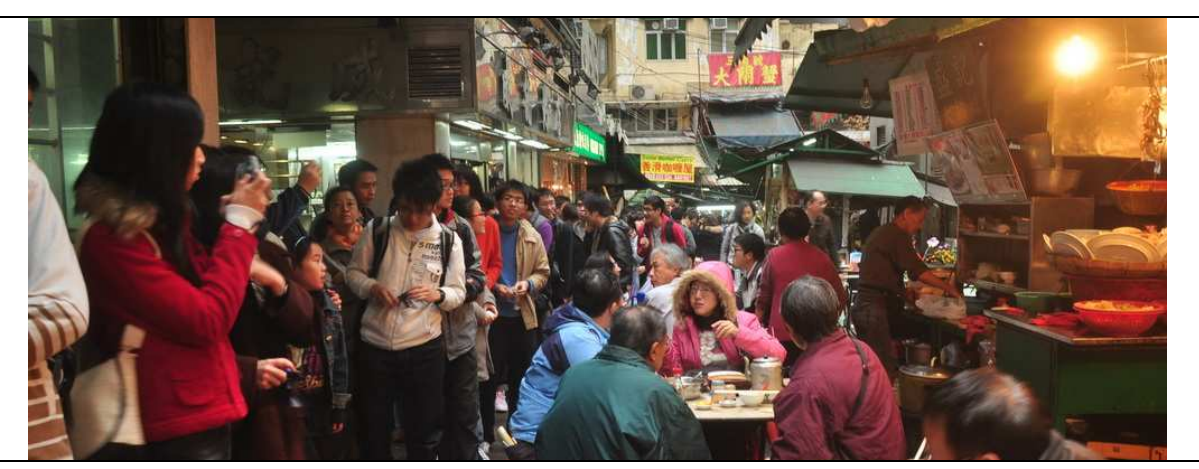
Visit of Graham Street and the nearby community