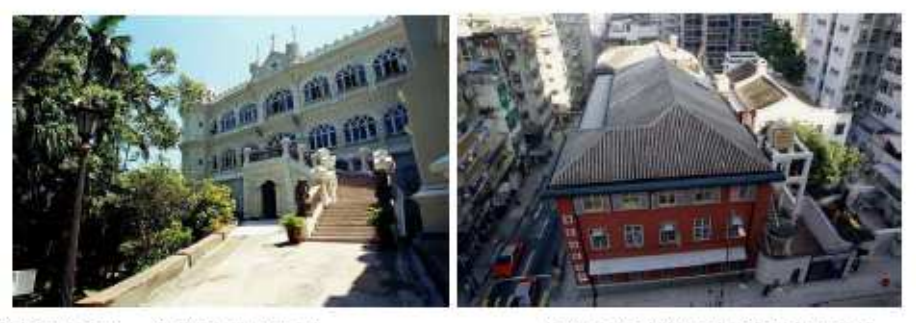
香港大學學生溢舍 - 大學堂(University Hall)