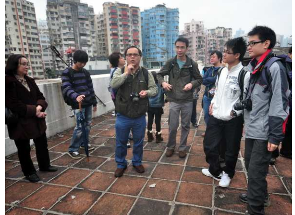
Discuss with participating mentors regarding the urban features of Kwun Tong Yue Man Fong