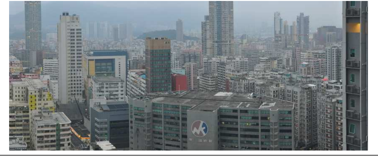
Seeing a transiting old district, Tai Kok Tsui, from building top