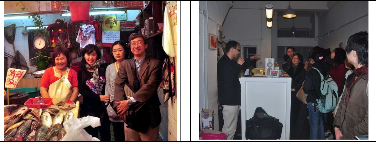
Meet with local community and understand their daily living